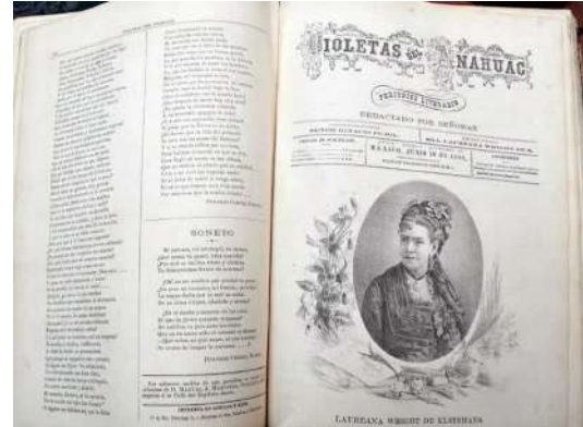
Violetas del Anáhuac, periódico literario del siglo 19 escrito en su totalidad por mujeres, fue donado al Acervo Histórico Diplomático de la Secretaría de Relaciones Exteriores (SRE).