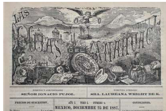
Las hijas del Anáhuac, encabezado, núm.4, 25 de diciembre de 1887.

muac.unam.mx/evento/coleccion-brillantina